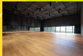
岡山芸術創造劇場ハレノワ アートサロン