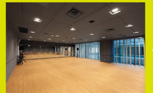
岡山芸術創造劇場ハレノワ 練習室