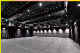
岡山芸術創造劇場ハレノワ 小劇場